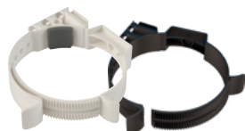
Beugel 100-131 PP