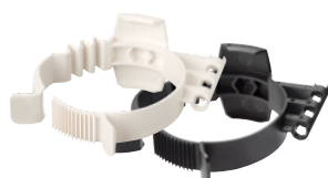
Beugel 80 PP