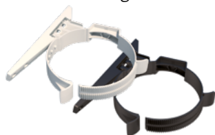
Dakbeschothbeugel 100-131 PP

Om te voorkomen dat, bijvoorbeeld bij storm, uw dakdoorvoer losraakt en voor gevaarlijke situaties kan gaan zorgen, is veilige montage een must. De kunststof Dakbeschothbeugel van Ubbink bevestigt u aan de zijkant. Doordat de beugel een zwenkend gedeelte heeft, positioneert, tekent, boort en bevestigt u de beugel eenvoudig aan het dakbeschoth. Vervolgens sluit u de beugel, zonder gereedschap, om uw dakdoorvoer. Deze beugel is ook achteraf te plaatsen en sluit naadloos aan op het Ubbink Luchtdicht Dakdoorvoermanchet. Voor een luchtdichte aansluiting plaatst u eerst de dakdoorvoer, dan het Luchtdicht Manchet en na positionering plaatst u de Dakbeschothbeugel via het manchet tegen het dakbeschoth.