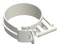
Beugel 60 PP

Dankzij het unieke ontwerp van de beugels kunt u het hele rookgasafvoersysteem positioneren, aftekenen, boren en dan eenvoudig bevestigen. Dus een keer opbouwen is genoeg. Ook geen gepruts meer achter de rookgasafvoerleiding om af te tekenen en maar gokken op de juiste hoogte. Met het Ubbink beugelprogramma kunt u overal makkelijk bij.