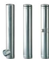
Etage Ketel Set